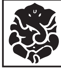
श्री गणेशाय नमः श्री सरस्वत्यै नमः

ज्योतिष प्रभाकर, वास्तु शास्त्राचार्य, अंक विशारद प्रधानाचार्य: भविष्य सुधारक एजुकेशनल रिसर्च इन्स्टीट्यूट, आगरा